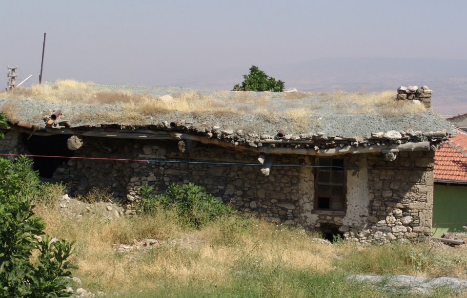
Ek 2: Mübadil Abidin oğlu Sabri Davran'ın iskan olduğu toprak damlı ev (arka taraf)