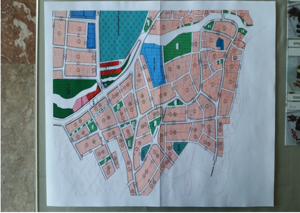
Ek 10: Honaz Belediyesi (Hisar Mahallesi) 2015