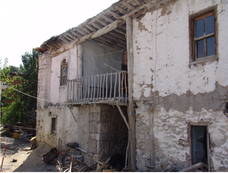
EK 1: Mübadil Abidin oğlu Sabri Davran'ın iskan olduğu toprak damlı ev (ön taraf) (ev yıkılmıştır)