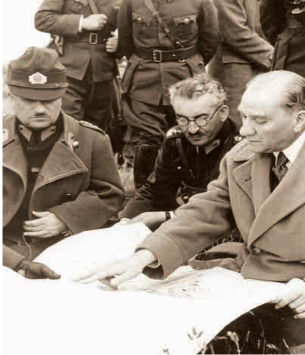
Ek 1: Ali Fuad Erden (Sol başta), Trakya Manevralarında Mustafa Kemal Atatürk ile (1936).