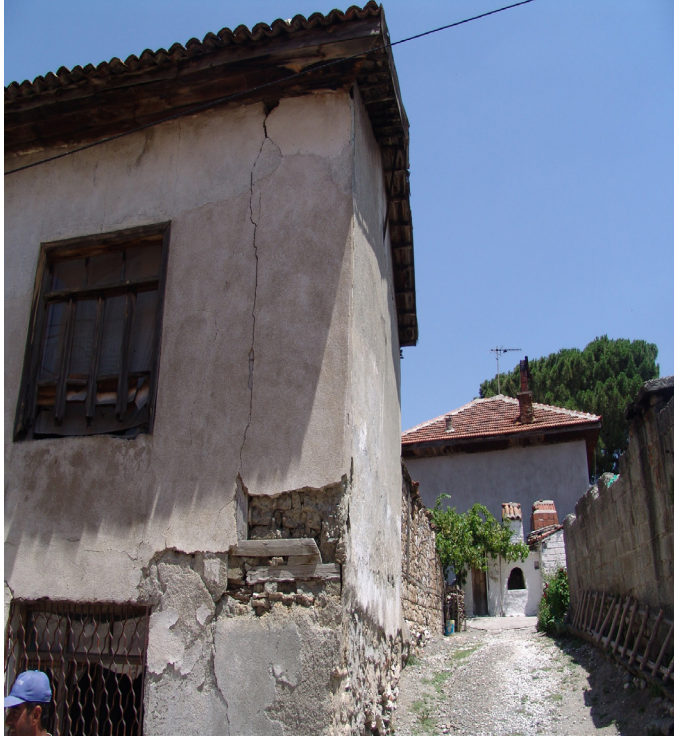
Ek 8: Göçmen Fırını (Orijinal)