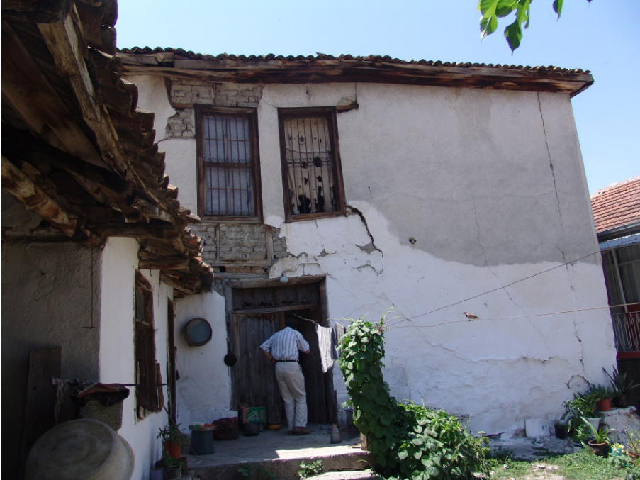
Ek 4: Mübadil Muhittin Yavuz'un iskan olduğu kiremit çatılı ev (arka taraf)