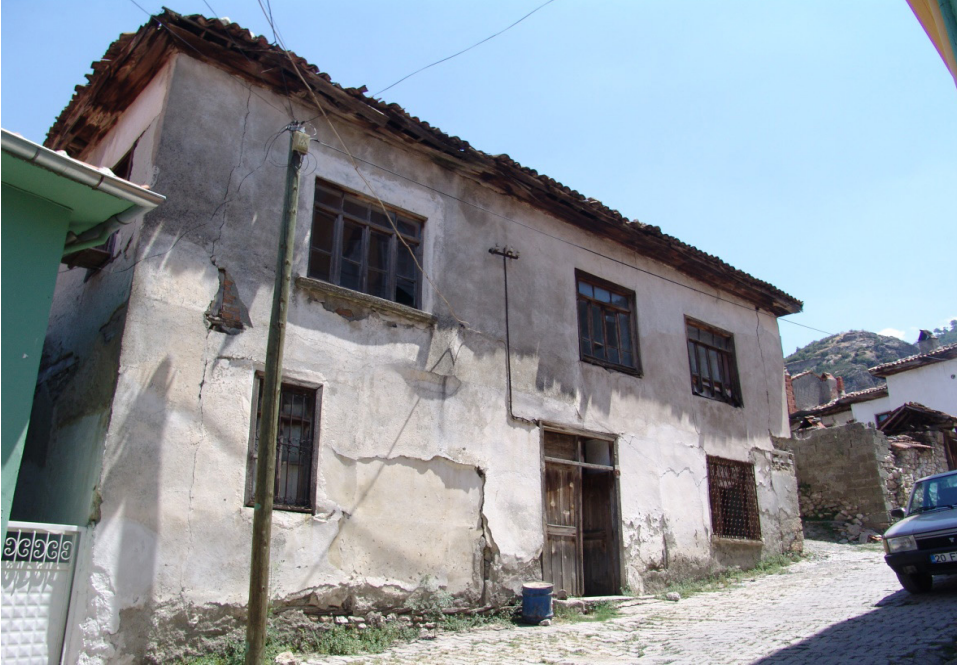
Ek 3: Mübadil Muhittin Yavuz'un iskan olduğu kiremit çatılı ev (ön taraf) (ev yıkılmıştır)