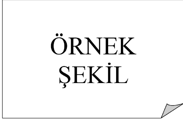
Şekil 2.2 : Üst yapılar.

At vero eos et accusam et justo duo dolores et ea rebum. At vero eos et accusam et justo duo dolores et ea rebum. At vero eos et accusam et justo duo dolores et ea rebum.