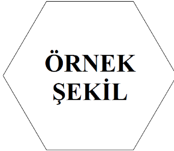
Şekil 4.1 : Örnek şekil.

Stet clita kasd gub rgren, no sea takimata sanctusest Lorem ipsum dolor sit amet, consetetur sadipscing elitr, sed diam nonumy eirmod tempor invidunt ut lab ore sit et dolore magna.