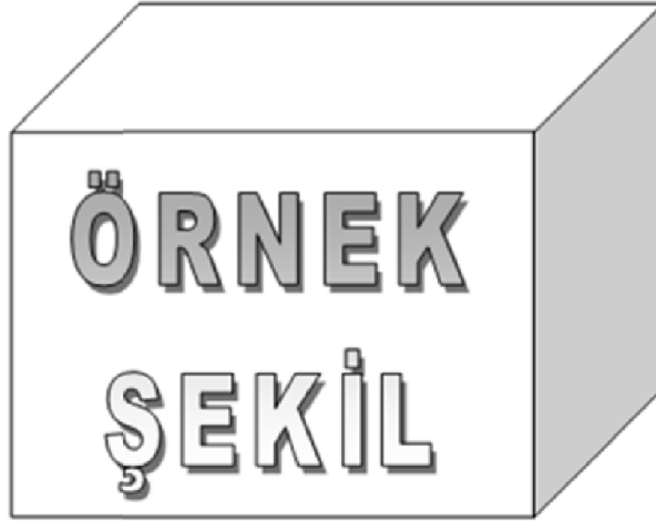
Şekil 2.1 : Tüm şekil ve çizelgeler ile bunların açıklamaları yazı bloğuna göre ortalı olarak yerleştirilmelidir.

Tüm şekil ve çizelgeler ile bunların açıklamaları yazı bloğuna göre ortalı olarak yerleştirilmelidir.