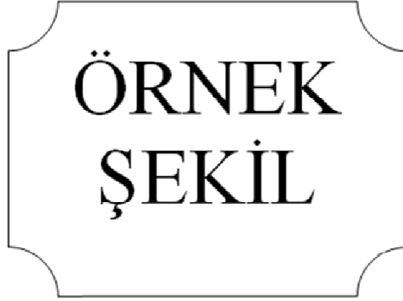
Şekil 6.1 : Altıncı bölümde örnek şekil.