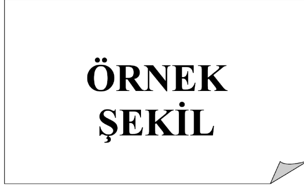
Şekil 3.2 : Birden fazla satırlı şekil isimlendirilmesinde önemli nokta satırların aynı hizada başlamasıdır.

Lorem ipsum dolor sit amet, consetetur sadipscing elitr, sed diam nonumy eirmod tempor invidunt ut labore et dolore magna aliquyam erat, sed diam voluptua. At vero eos et accusam et justo duo dolores et ea rebum. Stet clita kasd gub rgren, no sea takimata sanctusest Lorem ipsum dolor sit amet, consetetur sadipscing elitr, sed diam nonumy eirmod tempor invidunt ut lab ore sit et dolore magna.