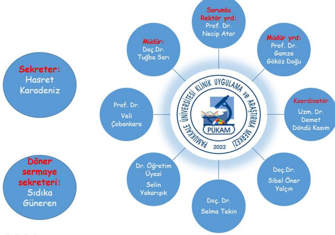
Şekil 1: PÜKAM Organizasyon Şeması